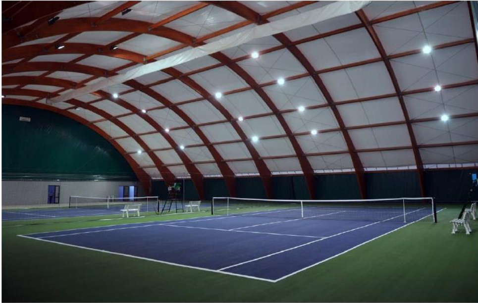
Idejno rješenje multifunkcionalne sportske hale

U 2021. godini plan je u sklopu ŠRC-a Đurđevac izgraditi i novu multifunkcionalnu sportsku halu u suradnji s Gradom Đurđevcom. Ovim projektom želi se unaprijediti sportska infrastruktura koja će biti na raspolaganju klubovima koji aktivno sudjeluju u animaciji mladih te oživljavanju sportskog života u Đurđevcu kroz uključivanje mladih i starijih rekreativaca u bavljenje sportom, uz jednake i ravnopravne uvjete.