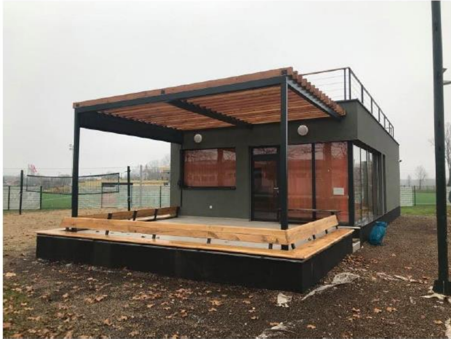
Zgrada teniskog kluba

Tenis je u Đurđevcu prisutan od daleke 1928. godine dok je prvi teniski klub u Đurđevcu osnovan 1983. godine, kada se krenulo i s izgradnjom teniskih terena. Danas je u Teniski klub Đurđevac i njegove aktivnosti uključeno 60-oro djece u školi tenisa (školska djeca) i igraonici tenisa (vrtićka djeca) te 40 članova rekreativaca. Iz godine u godinu Teniski klub Đurđevac se razvija u svim smjerovima, ima sve veći broj natjecatelja, sudjeluje na turnirima, ali i postiže sve značajnije rezultate.